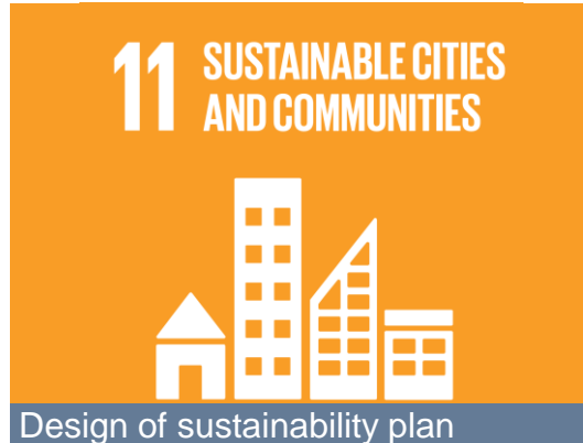
Design of sustainability plan