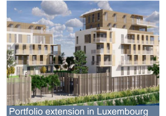
Portfolio extension in Luxembourg