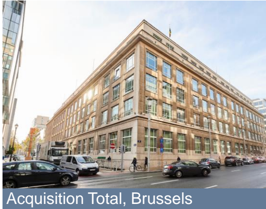
Acquisition Total, Brussels

Apart from a number of strong commercial transactions, we strengthened our financial position. We also streamlined our sustainability approach.