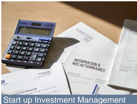
Start up Investment Management