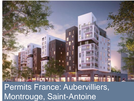
Permits France: Aubervilliers, Montrouge, Saint-Antoine