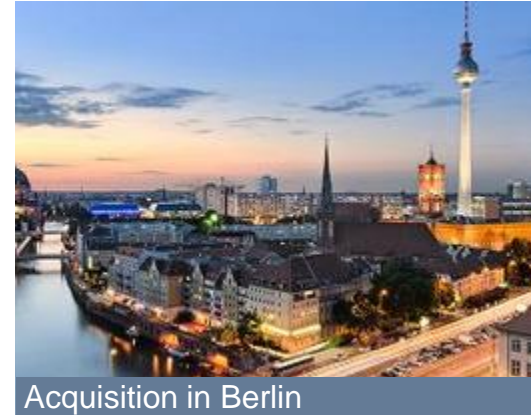
Acquisition in Berlin

TATES (INCLUDING ITS TERRITORIES AND POSSESSIONS, ANY STATE OF OR THE DISTRICT OF COLUMBIA), AUSTRALIA, CANADA, JAPAN, SOUTH AFRICA, SWITZERLAND, THE UNITED STATES OF AMERICA, THE UNITED KINGDOM OF GREAT BRITAIN AND NORTHERN IRELAND, IN WHICH SUCH RELEASE, PUBLICATION OR DISTRIBUTION IS ILLEGAL.