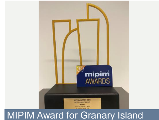
MIPIM Award for Granary Island